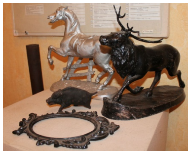
Изделия Нювчимского чугунолитейного завода, хранящиеся в музее истории и культуры Сыктывдинского района им. Э. А. Налимовой.