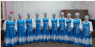
Нювчимский народный хор им. П. И. Чисталёва.