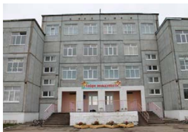
Здание средней общеобразовательной школы с. Зеленец.