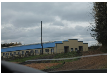
В 2014 году в Шошкинском отделении проведена масштабная реконструкция животноводческого комплекса.