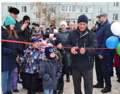
Торжественное открытие универсальной спортивной площадки. 2019 год.