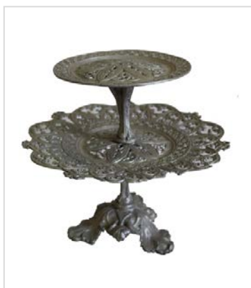
Ажурная ваза (сухарница). Из уникальной коллекции художественного литья Нювчимского чугунолитейного завода.