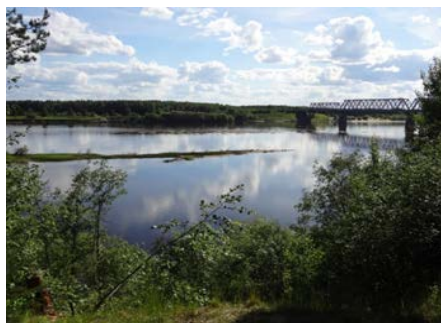
Окрестности села Часово.