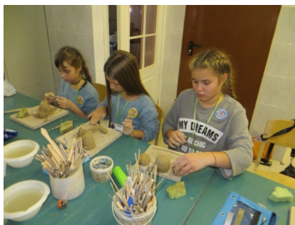
Занятие в «Гончарике».