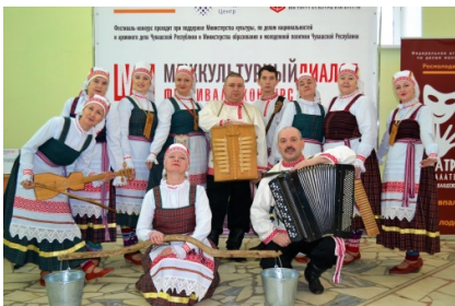
Народный хор «Зарава».