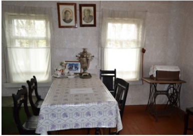
Внутреннее убранство дома-музея.

95 лет со дня рождения Чисталёва Прометея Ионовича // Календарь знаменательных и памятных дат Сыктывдинского района на 2016 год / МБУК «Сыктывдинская централизованная библиотечная система», Центральная библиотека, Методико-библиографический отдел, сост. Н. Г. Виноградова, ред. Л. Н. Муравьёва, И. Г. Жукова. - Выльгорт, 2015. - С. 12-14