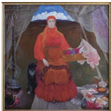
Станислав Торлопов «Мать-земля Коми» (1978) Размер полотна – 212х200 см. Источник: https://cutt.ly/ugl6d14

С. А. Торлопов родился в 12 октября 1936 года в Москве, когда родители учились в столице.