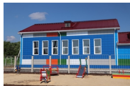
Новая школа-сад в с. Часово.