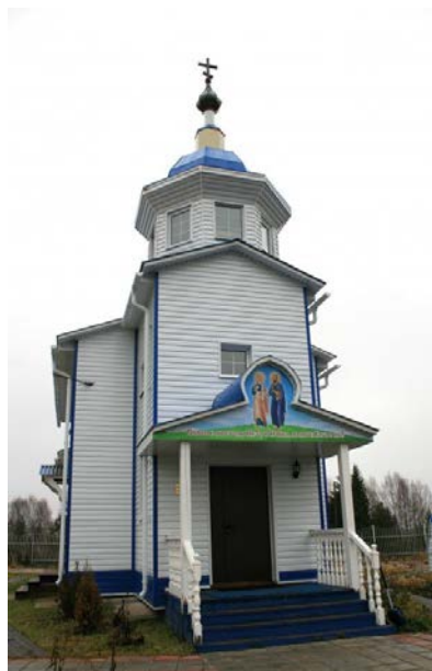
Храм в честь Первоверховных апостолов Петра и Павла.