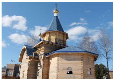
Строящийся храм Сретения Господня в центре села Выльгорт.