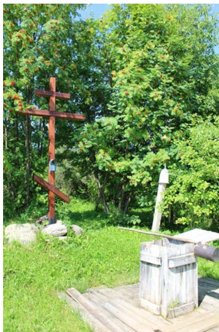
Святой источник в м. Чулиб, где ранее был храм великомученицы Параскевы Пятницы.