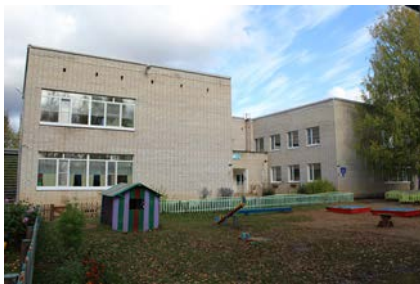
Детский сад с. Пажга.