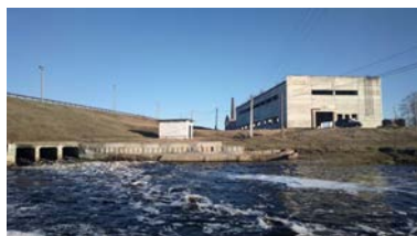
Новый корпус чугунолитейного завода, построенный в 1980-ые годы.