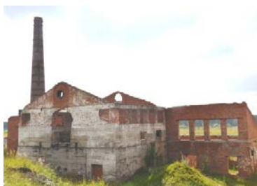
Остов бывшего чугуно-литейного завода в Нювчине.

265 лет со дня открытия (1756 г., 15 марта)