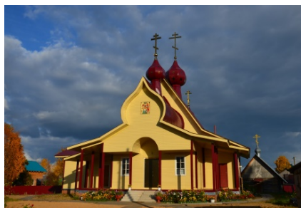
Церковь Богоявления Господня. 2013 г.