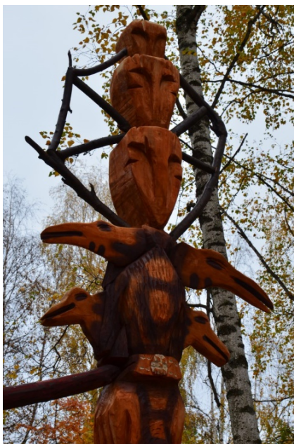
Одна из деревянных скульптур.