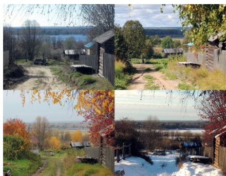
с. Шоска. Времена года.