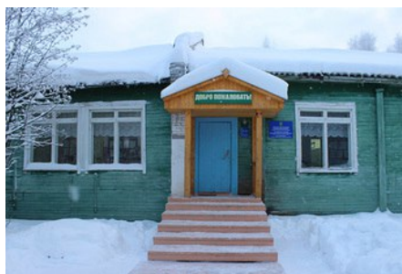
Старое здание школы.

Часово – административный центр Часовского сельского поселения. Первое упоминание о селе Часово встречается в 1586 году. Одним из основных занятий жителей была охота на пушного зверя.