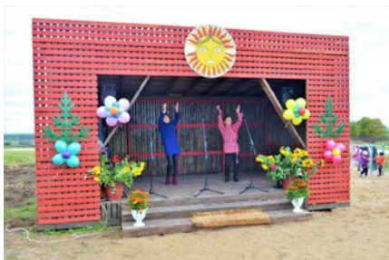
Зона отдыха с оборудованной сценой под открытым небом.