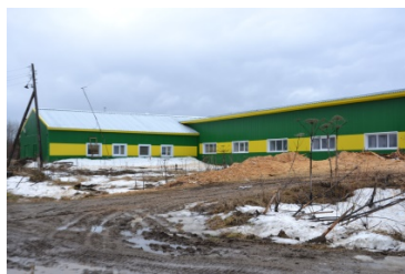
Модернизированная ферма ООО «Пажга».