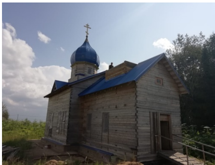
Строящийся храм Покрова Пресвятой Богородицы.