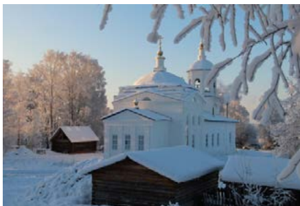
Храм Архангела Михаила в с. Шоска Фото Нины Потаповой.