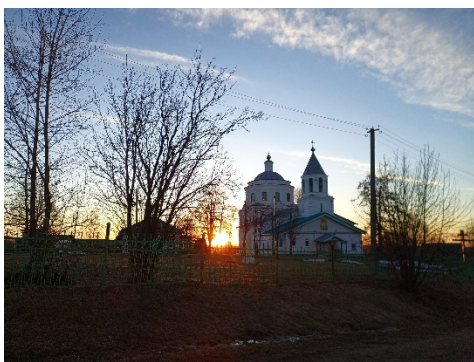
Фото из архива В. Мальцева, с. Ыб.

190 лет назад, в 1835 году в селе Ыб открылась каменная Свято-Вознесенская церковь по проекту ключаря Софийского собора г. Вологды иерея П. Иконникова с тремя престолами – Вознесения, Ильи Пророка и Святого Николая-Чудотворца.