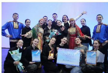
На снимке: ансамбль танца «Отрада».