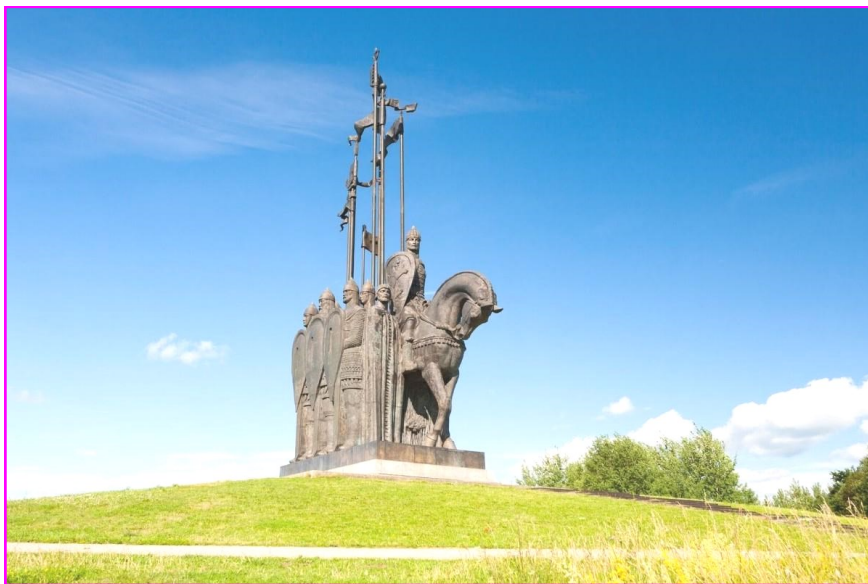
Монумент «Ледовое побоище». Псковская область. Гора Соколиха. Установлен в 1993 году. Общая высота памятника - 30,70 метров.

В следующем, 1241 году немецкие рыцари захватили крепость Копорье и приблизились к Новгороду. В этом же году Александр Невский разбил большую часть гарнизона крепости, а через